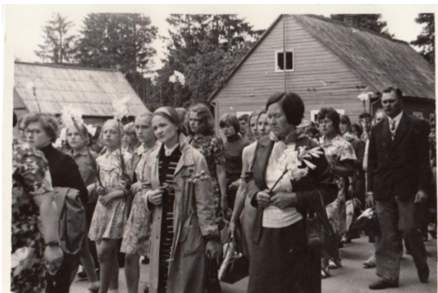
Eucharistinio Jėzaus kongregacijos seserys Šiluvoje. 1978 m.